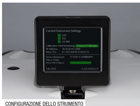
CONFIGURAZIONE DELLO STRUMENTO