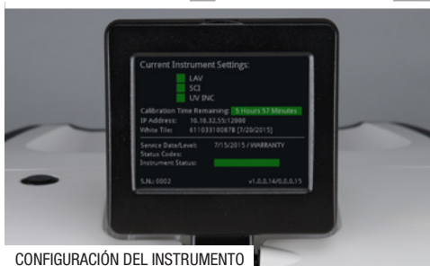
CONFIGURACIÓN DEL INSTRUMENTO