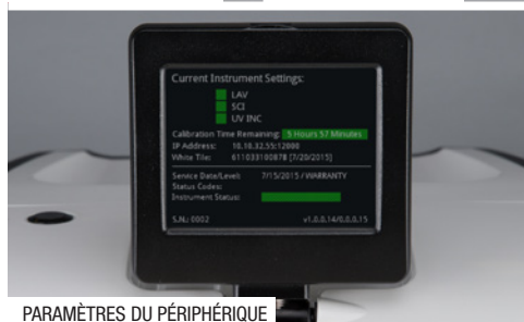
PARAMÈTRES DU PÉRIPHÉRIQUE